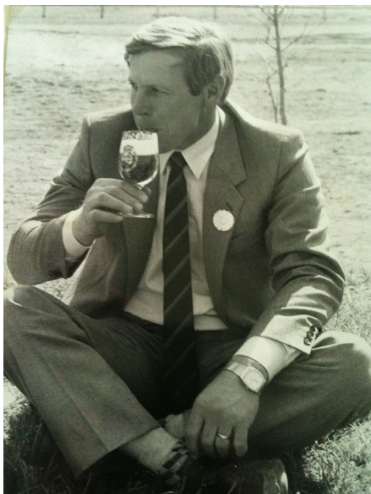
Elegant und doch unkompliziert