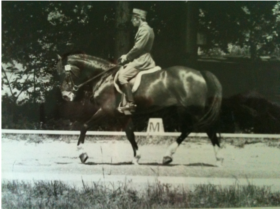
Fucina machte auch im Viereck was her...